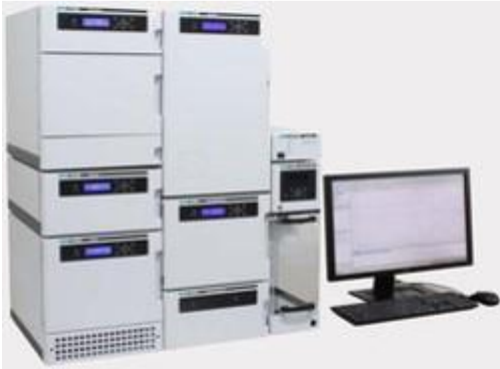
Jasco SFC-4000