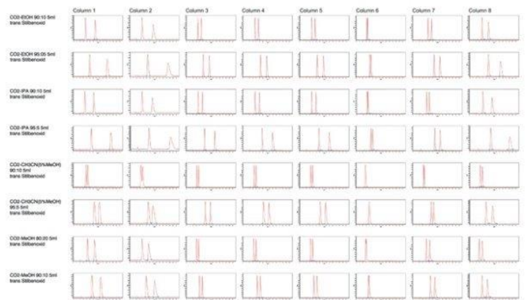
Sepiatec Sepmatix 8x Screening SFC-System (Sepiatec Produktinformation)